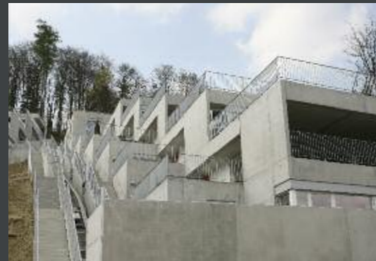
Terrassenhäuser, Schafisheim Architektur: Bieri Architekten AG, Langenthal mit Zimmermann Architekten, Aarau