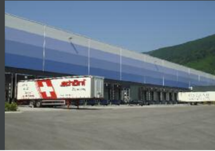
Neubau Logistikcenter Gazeley, Niederbipp Ingenieur: SRIG-Monod Ingénieurs SA, Lausanne