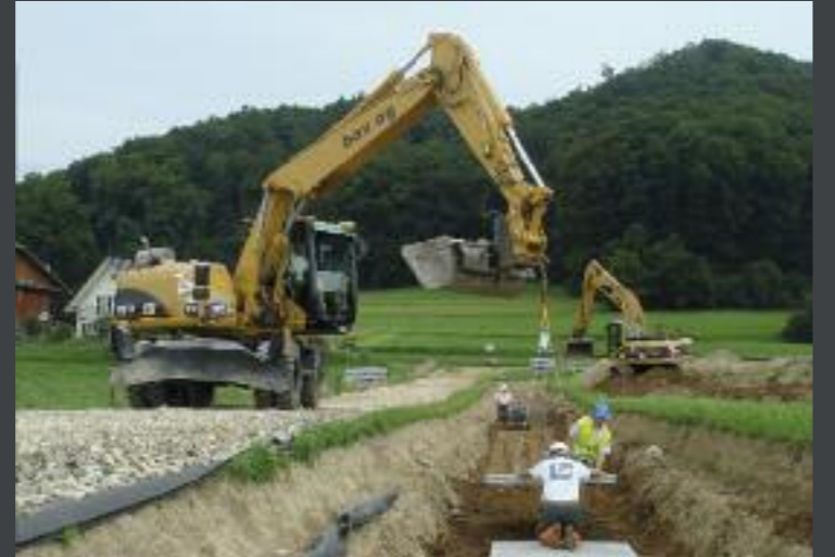
Verlegung Erdgasleitung, Reiden Ingenieur: B + S AG, Bern