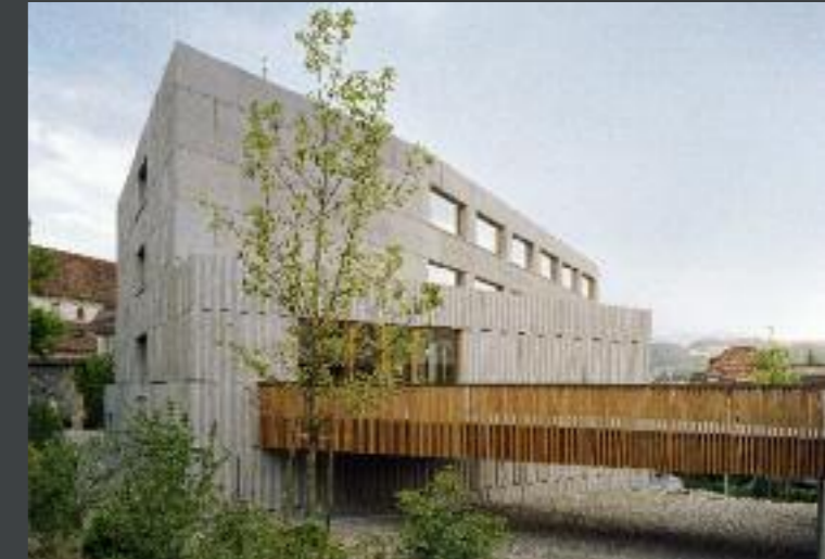
Neubau Schulhaus Dreilinden, Luzern ARGE Architektur: Lussi + Halter Architekten, Luzern