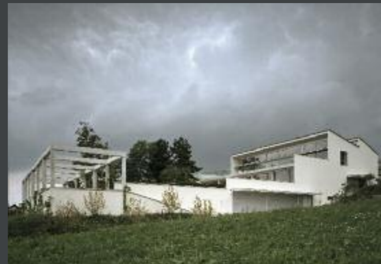
Villa Eltschinger, Hildisrieden Architektur: Masswerk Architekten, Kriens