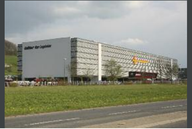
Neubau Parkhaus Galliker Car Logistics, Nebikon ARGE Architektur: Anliker AG, Emmenbrücke