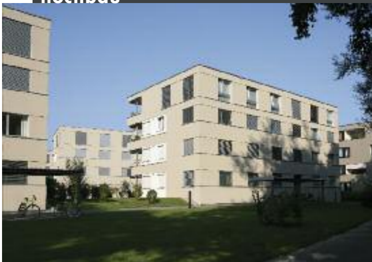
Überbauung Mühlehof, Sursee Architektur: Masswerk Architekten, Kriens mit W. & R. Leuenberger AG, Nebikon