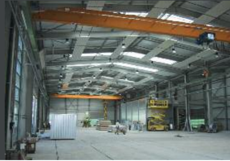
Neubau und Erweiterung Alho AG, Wikon Architektur: W. & R. Leuenberger AG, Nebikon