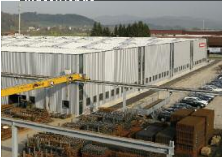
Neubau und Erweiterung Stahl Reiden AG, Reiden Architektur: W. & R. Leuenberger AG, Nebikon