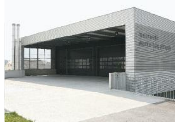
Werkhof und Feuerwehrmagazin, Häggligen Architektur: Xaver Meyer AG, Villmergen