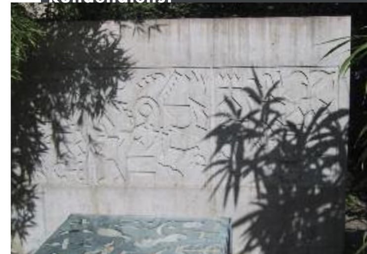
Gartenrelief Haus Abt, Reiden Kunst: Hugo Schär, Giswil