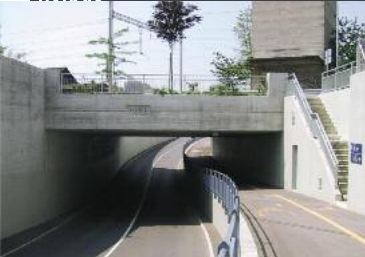
SBB Unterführung, Wikon ARGE Ingenieure: Tschopp + Wespi, Hergiswil mit Emch + Berger AG, Zofingen